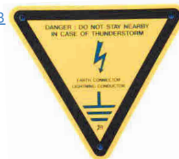
AFH 8000 GB