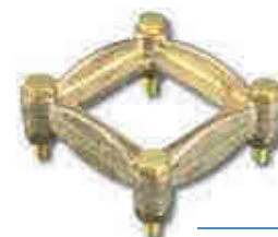
AFK 0004 RM

Este empalme está utilizado para la conexión de 3 ramas de la pata de ganso. Es posible conectar más.