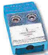
AFK 0080 BC

Una junta de control debe ser instalada en cada conductor de bajada para permitir desconectar el conductor de la puesta a tierra. Esta instalada entre la funda de protección (réf AFK4200FP) y el contador rayo (AFV0907CF, AFV0906CF, AFV0909CF).