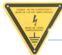
AFH 8000 PS

Debe ser legible a 36 metros de distancia y deber estar instalada a altura de lectura.