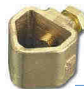
AFK 0020 RP