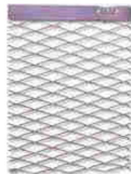
AFK 0900 GT