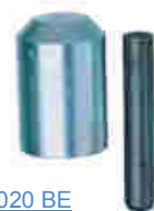
AFK 2020 BE