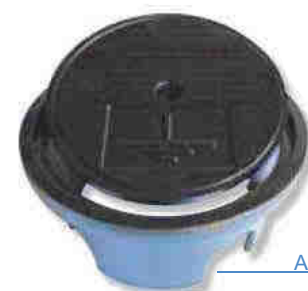
AFK 8001 RV