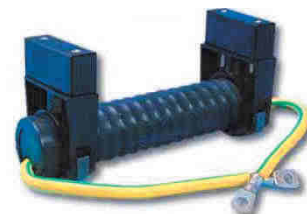
AFK 0001 ST

Esta bobina se instala lo más cerca de la tierra de las masas (pared o cámara de registro de control).