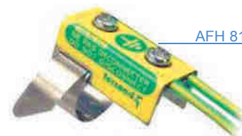
AFH 8102 CE