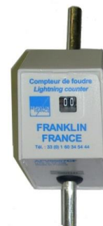
Contador de rayo AFV0907CF