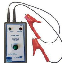
Probador cableado AFV0050TT

La alimentación de este probador se hace con una batería (incluida). La visualización con luces indicadoras indica el resultado al instante (positivo o negativo).