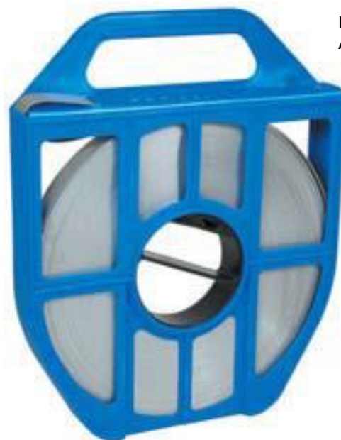
Feuillard de cerclage inox AFD 1410 BC

La chape inox AFD1610BC permet de verrouiller le feuillard de cerclage AFD1410BC.