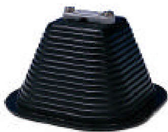
une attache AFH8040PC

Ces plots permettent de fixer les conducteurs méplats ou ronds en toiture sans nuire à l'étanchéité. Il peut également être installé des toitures végétalisées ou gravillonnées.