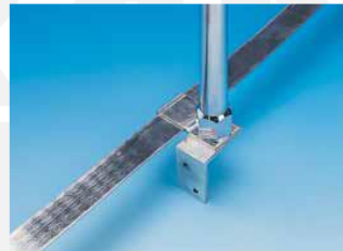
Support équerre, AFF0836PC + AFF0501PC