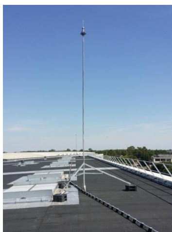
Ejemplo de utilización

Este mástil, en acero inoxidable, se compone de un tubo de una longitud de 2 metros fresado en sus extremidades (Ø28mm), de un enmangado (AFC 3434 MR) y de cuatro collares que permiten mantener el conductor de bajante de tipo pletina.