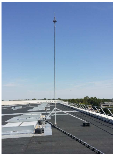
Active ZD ® fixé avec des pattes AFZ0420PD / trépied AFD3300FS et dalles AFH8045DA